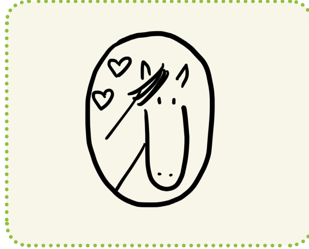
weiß immer, was ich will.